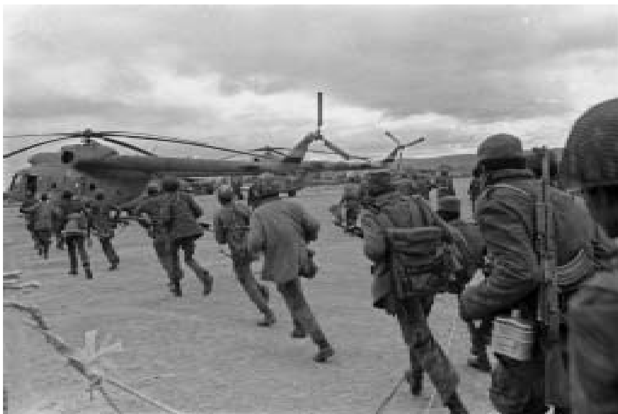
Revista Casa de las Américas No. 266 enero-marzo/2012 pp. 169-174